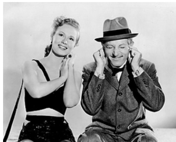
1948 SI BÉMOL ET FA DIÈSE (A Song is born) d'Howard Hawks avec Danny Kaye