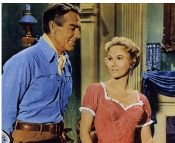
1958 LE COURRIER DE L'OR (Westbound) de Budd Boetticher avec Randolph Scott