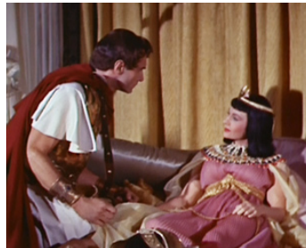
1957 L'HISTOIRE DE L'HUMANITÉ (The Story of Mankind) d'Irwin Allen