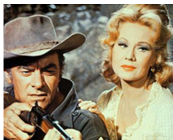
1966 FORT UTAH (Fort Utah) de Lesley Selander avec John Ireland