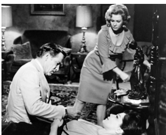
1965 CASTLE OF EVIL de Francis D. Lyon avec Scott Brady, Lisa Gay