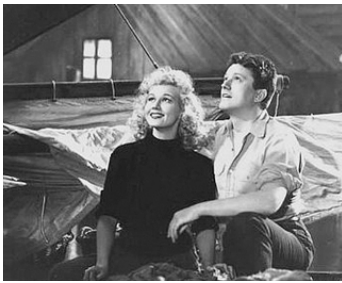
1943 LA VIE AVENTUREUSE DE JACK LONDON (Jack London) de J. Santley avec Michael O'Shea