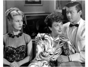
1947 AU-DESSUS DU CIEL (Out of the Blue) de Leigh Jason avec Ann Dvorak, Turhan Bey