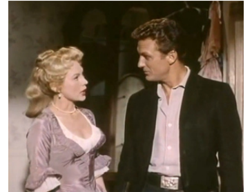
1956 L'OR ET L'AMOUR (Great Day in the morning) de J. Tourneur avec Robert Stack