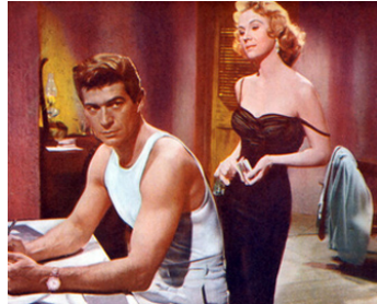
1955 INTRIGUE AU CONGO (Congo Crossing) de Joseph Pevney avec George Nader