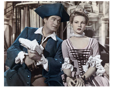
1944 LA PRINCESSE ET LE PIRATE (The Princess and the Pirate) de David Butler avec Bob Hope