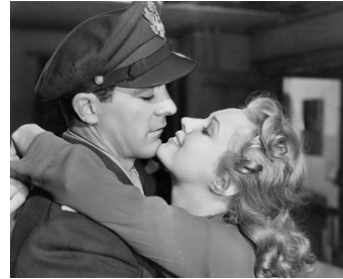
1946 LES PLUS BELLES ANNÉES DE NOTRE VIE de William Wyler avec Dana Andrews