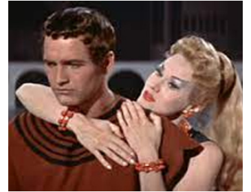
1954 LE CALICE D'ARGENT (The silver Chalice) de Victor Saville avec Paul Newman