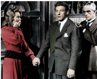
1947 LA VIE SECRÈTE DE WALTER MITTY de Norman Z. McLeod avec Danny Kaye