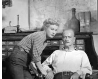
1953 LA NUIT SAUVAGE (Devil's Canyon) d'Alfred L. Werker avec Robert Keith