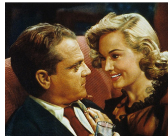
1949 L'ENFER EST À LUI (White Heat) de Raoul Walsh avec James Cagney