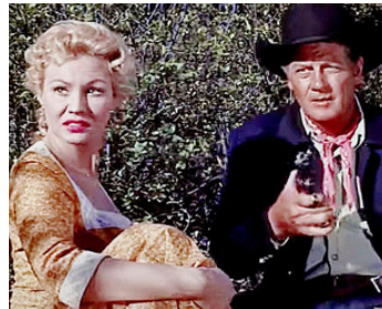
1957 VIOLENCE DANS LA VALLÉE (The tall Stranger) de Thomas Carr avec Joel McCrea