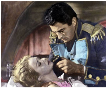
1951 CAPITAINE SANS PEUR (Captain Horatio Horriblower) de R. Walsh avec Gregory Peck