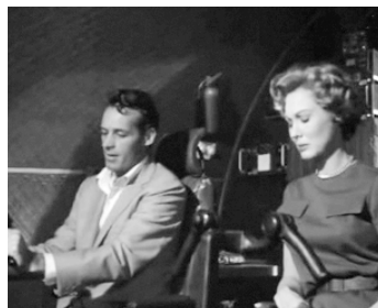
1959 JET OVER THE ATLANTIC de Byron Haskin avec Guy Madison