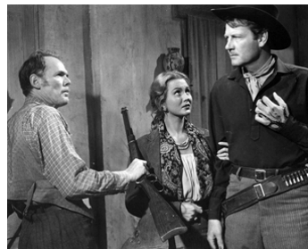
1949 LA FILLE DU DÉSERT (Colorado Territory) de Raoul Walsh avec Henry Hull, Joel McCrea