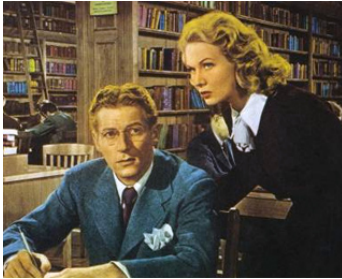
1945 LE JOYEUX PHÉNOMÈNE (Wonder Man) de B. Humberstone avec D. Kaye, Natalie Schafer