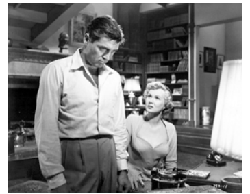
1953 CATHERINE ET SON AMANT (She's back on Broadway) de G. Douglas avec Steve Cochran