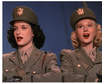
1943 UN FOU S'EN VA-T-EN GUERRE (Up in Arms) d'Elliott Nugent (figuration)