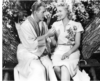
1946 LE LAITIÈRE DE BROOKLYN (The Kid from Brooklyn) de Norman Z. McLeod avec D. Kaye