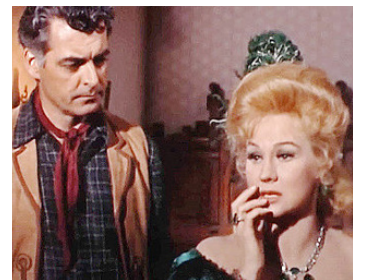
1964 FURIE SUR LE NOUVEAU-MEXIQUE (Young Fury) de Ch. Nyby avec Rory Calhoun