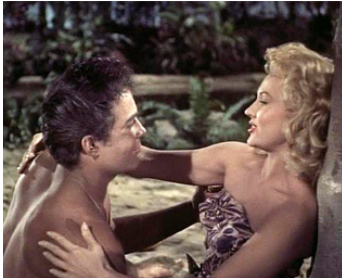
1955 LES PERLES SANGLANTES (Pearl of the South Pacific) d'Allan Dwan avec Lance Fuller