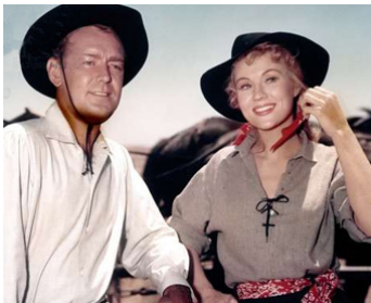
1956 LES LOUPS DANS LA VALLÉE (The big Land) de Gordon Douglas avec Alan Ladd