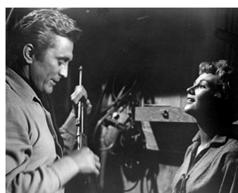
1951 LE DÉSERT DE LA PEUR (Along the great divide) de Raoul Walsh avec Kirk Douglas