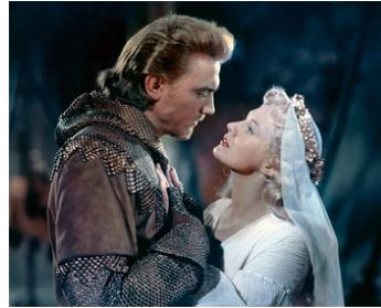
1954 RICHARD CŒUR DE LION (Richard and the Crusaders) de D. Butler avec Laurence Harvey