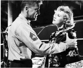
1953 LE BAGARREUR DU PACIFIQUE (South Sea Woman) d'Arthur Lubin avec Burt Lancaster