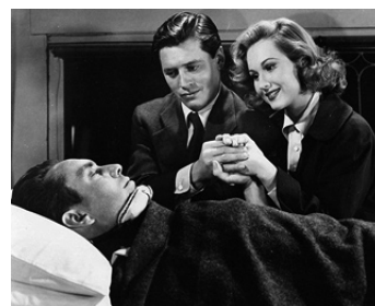
1949 DU SANG SUR LE TAPIS VERT (Backfire) de V. Sherman avec E. O'Brien, Gordon McRea