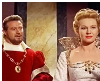
1960 LA RÉVOLTE DES MERCENAIRES de Piero Costa avec Conrado San Martín