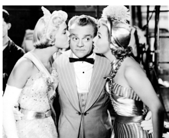
1950 LES CADETS DE WEST POINT (The West Point Story) de R. Del Ruth avec Doris Day, J. Cagney