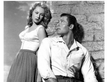
1958 SUR LA PISTE DES COMANCHES (Fort Dobbs) de Gordon Douglas avec Clint Walker