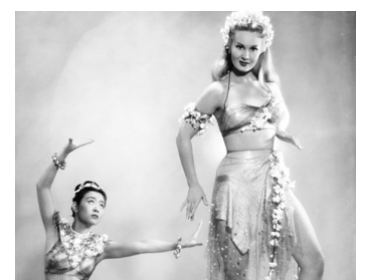
1951 LA RONDE DES ÉTOILES (Starlift) de Roy Del Ruth