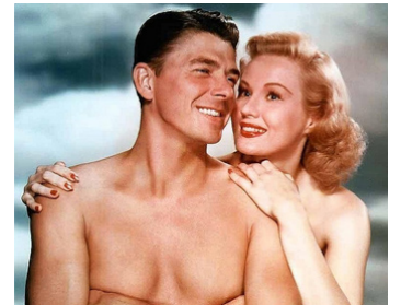
1948 VÉNUS DEVANT SES JUGES (The Girl from Jones Beach) de P. Godfrey avec R. Reagan