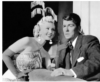
1952 LA COLLÉGIENNE EN FOLIE (She's working her way...) de B. Humberstone avec R. Reagan