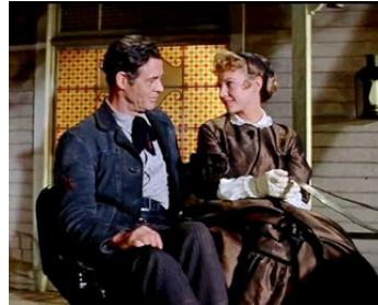
1956 LE SHÉRIF (The Proud Ones) de Robert D. Webb avec Robert Ryan