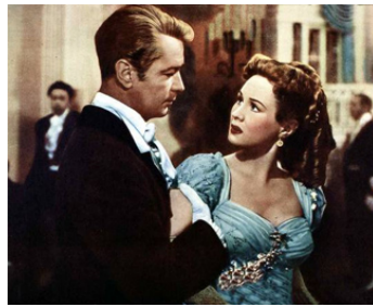
1952 LA MAÎTRESSE DE FER (The iron Mistress) de Gordon Douglas avec Alan Ladd