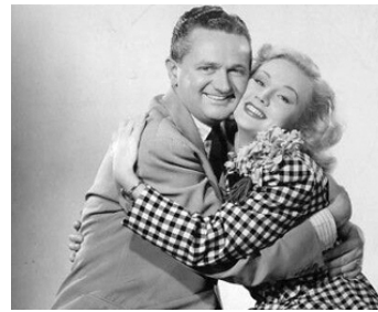
1944 SEVEN DAYS ASHORE de John H. Auer avec Wally Brown