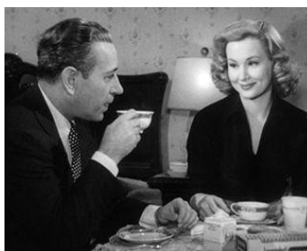
1949 FEU ROUGE (Red Light) de Roy Del Ruth avec George Raft