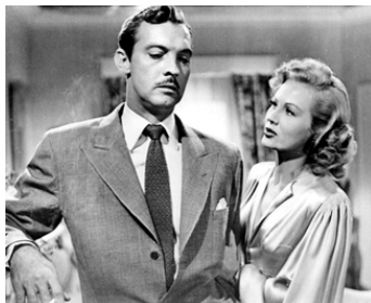
1948 LA GARCE (Flaxy Martin) de Richard L. Bare avec Zachary Scott