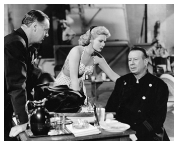
1949 ALWAYS LEAVE THEM LAUGHING de Roy Del Ruth avec Milton Berle, Bert Lahr